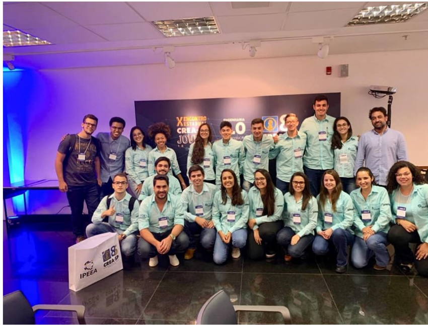
Figura 15 - I Maratona Hackathon CREA/ ASSEAG na Universidade São Judas Tadeu, em Guarulhos/SP