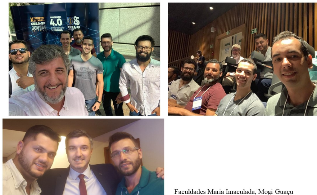
Faculdades Maria Imaculada, Mogi Guaçu