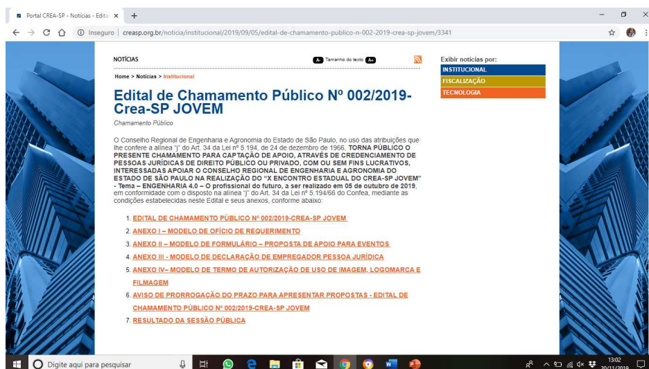
Figura 3 - Edital de chamamento público.