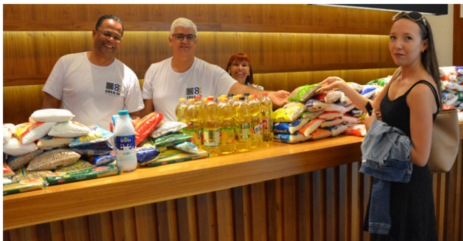
Figura 5- Arrecadação de alimentos perecíveis no X Encontro Estadual do Crea-SP Jovem.

CONSELHO REGIONAL DE ENGENHARIA E AGRONOMIA DO ESTADO DE SÃO PAULO - CREA-SP