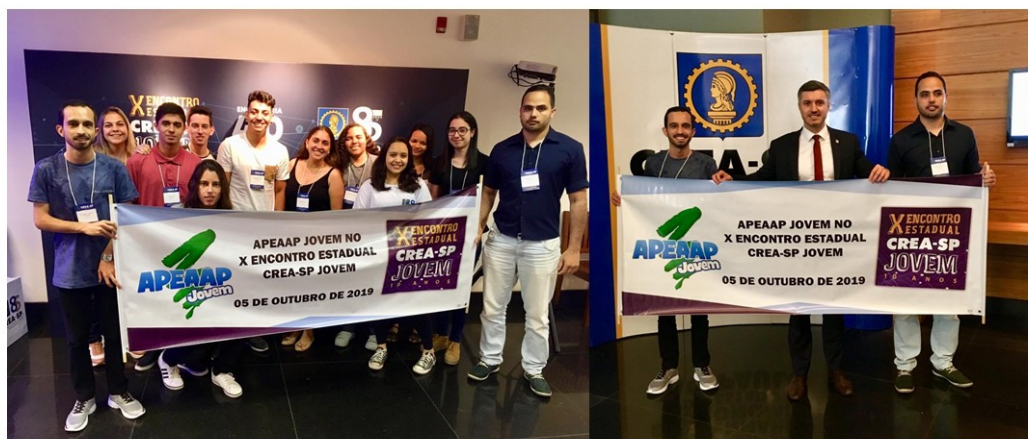
Figura 13 - Estudantes de Engenharia civil da Faculdade Maria Imaculada, Mogi Guaçu/ SP