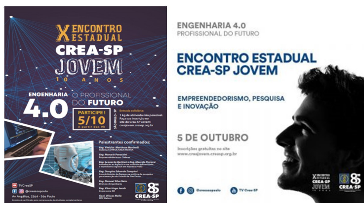
Figura 2 – Identidade visual do evento e camiseta.