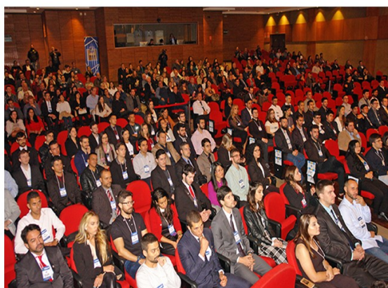
Figura 6 - Estudantes premiados, familiares e membros da Comissão Permanente do Crea-SP Jovem no 22º Prêmio Crea-SP de Formação Profissional na Universidade Presbiteriana Mackenzie

As Figuras de 6 a 19 registram os eventos realizados e/ou participações da comissão.