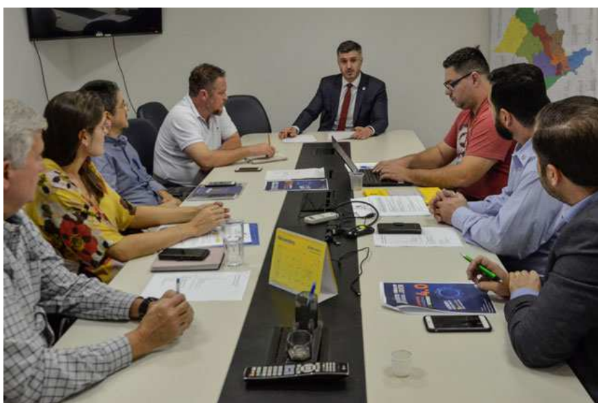
Figura 1- Reunião com o presidente do CREA-SP a fim de tratar sobre o X Encontro Estadual do Crea-SP Jovem.