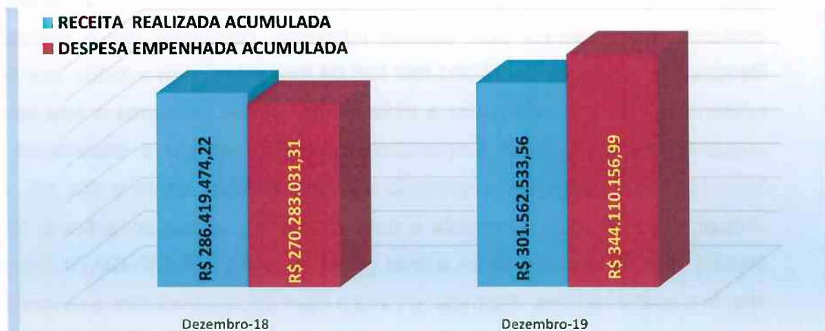
GRAFICO 1 - ANÁLISE DO RESULTADO: DESPESA EMPENHADA x RECEITA REALIZADA - ACUMULADO DEZEMBRO/19

Valores em R$