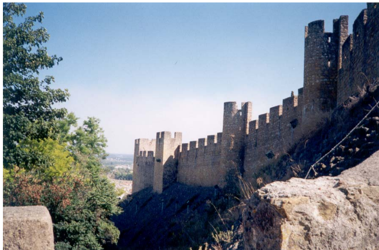
Figura 1- Fortaleza dos Templários; cidade de Tomar, Portugal, construída em 1160

A Fortaleza dos Templários localizada na cidade de Tomar em Portugal em 1160 dC, era abastecida com água de chuva.