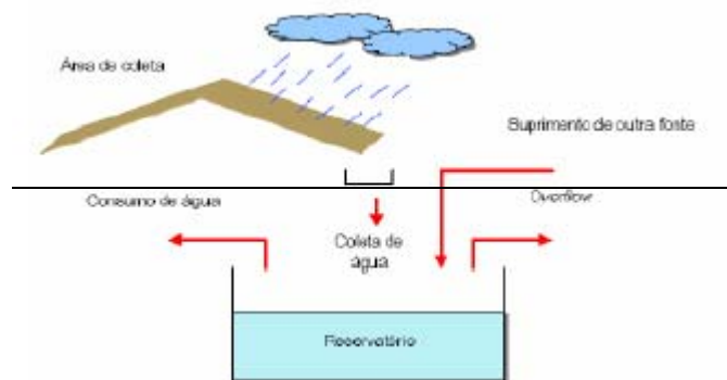
Figura 2- Esquema de aproveitamento de água de chuva

É a água coletada durante eventos de precipitação pluviométrica em telhados inclinados ou planos onde não haja passagem de veículos ou de pessoas. As águas de chuva que caem nos pisos residenciais, comerciais ou industriais não estão inclusas no sistema proposto.