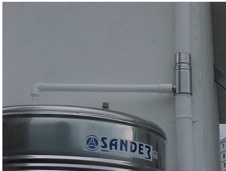
Figura 3- Reservatório de aço inox apoiado, observando o filtro metálico