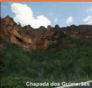
Chapada dos Guimarães